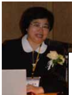
特別講演のために来日された国立台湾師範大学教授 鄭惠美先生からは、『台湾のヘルスプロモーション活動』が紹介された。

現在はヘルスプロモーションセンターを中心とした診療と近隣の複数の村での地域保健活動が並行して行われている様子が紹介された。その比重はというと、診療部門が資金、器材等の物的資源のほぼ70%、日本人スタッフの約60%を占め、その対象者は約800人であった。しかし資金、器材の30%、スタッフの40%で行っている地域歯科保健活動の対象者は7倍以上の約6000人になるという。キュアあり、プライマリヘルスケア、そしてヘルスプロモーションと、必要に応じて混在している現場の様子がリアルなスライドとともに語られた。